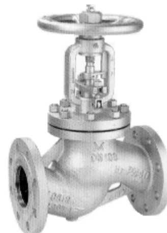
GAV 346, GAV 346/...

Kołnierze wykonane wg EN 1092-1 z przylgą typu B1.