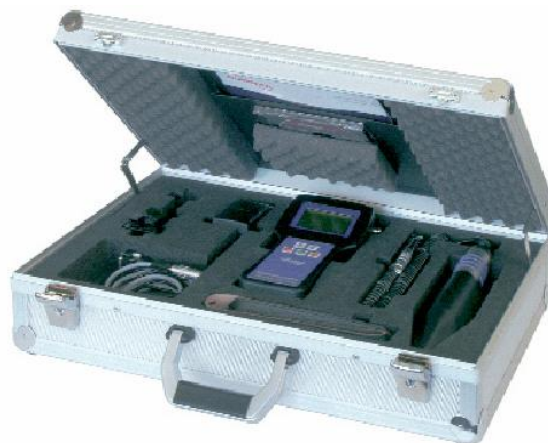
GESTRA Traptest VKP40